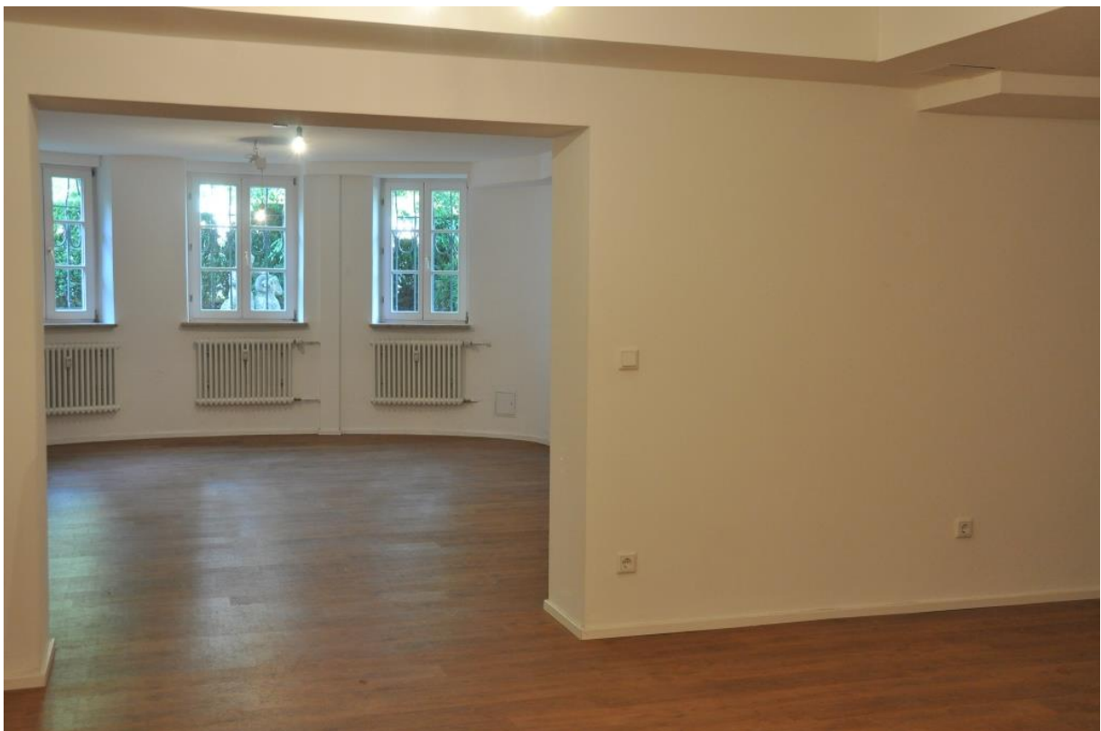
Blick von der Küche ins Wohnzimmer