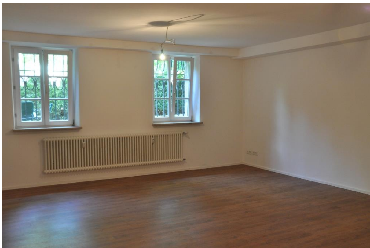
Büro / Kind